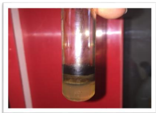
شکل (۴): سنجش ظرفیت امولسیون کنندگی نفت خام و گازوئیل