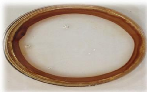
شکل (۳): گسترش نفت خام توسط سوپرناتانت کشت ۹ روزه باکتری

برای انجام این تست، سوپرناتانت کشت مورد استفاده قرار گرفت. ۲۵ میکرولیتر آب مقطر در پلیت ریخته و ۲۰ میکرولیتر نفت خام ۳۲ به عنوان منبع هیدروکربن به آن افزوده شد. سپس ۱۰ میکرولیتر از سوپرناتانت کشت به مجموع اضافه گردید. در این تست، از توئین ۸۰ به عنوان کنترل مثبت و از آب مقطر به عنوان کنترل منفی استفاده شد. پخش روغن به عنوان نتیجه مثبت تلقی و در واحد سانتیمتر اندازه گیری شد.