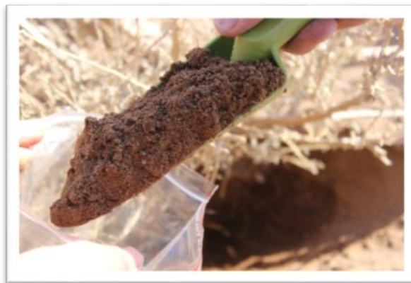
شکل (۱) : جمع آوری نمونه های خاک

در این بخش از کار، حدود ۵۰ نمونه خاک جمع آوری گردید. در هنگام نمونه برداری پارامترهای میزان شوری، pH بررسی گردید.